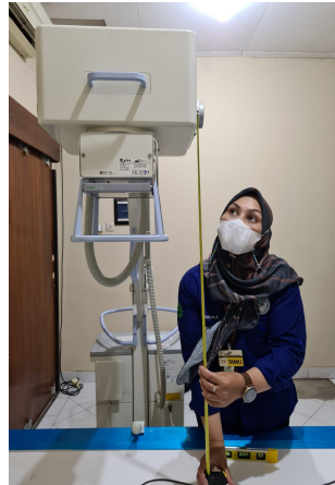
Pengukuran pesawat Radiografi Umum