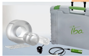
MagicMax CT Case