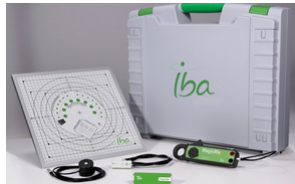
MagicMax Radiography/Fluoroscopy Case