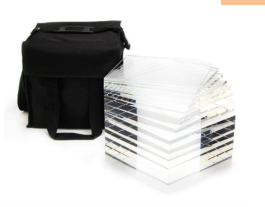
TO AEC Phantom