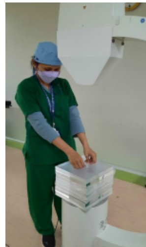
Pengukuran pesawat Panoramic